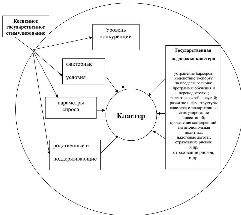
Рис.2. Модель государственно-частного партнерства в рамках кластера

( http://www.docme.ru/doc/1177/%D1%81%D1%82%D0%B0%D1%82%D1%8C%D1%8F-%D0%BE-%D0%BA%D0%BB%D0... )